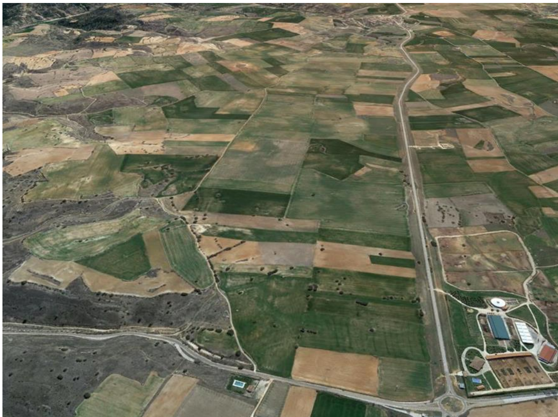
Vistas aéreas desde el extremo oeste y este respectivamente, de la zona afectada.