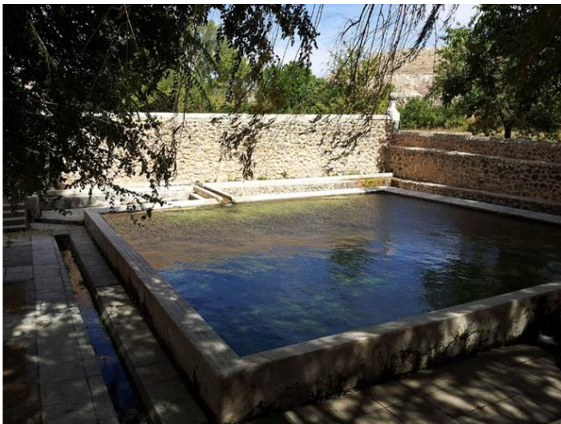
Vista de la fuente con agua.

De origen medieval y en los arrabales, de cuyo manantial probablemente trae el nombre la villa, según dijo el Concejo en 1575 al rey Felipe II de España.