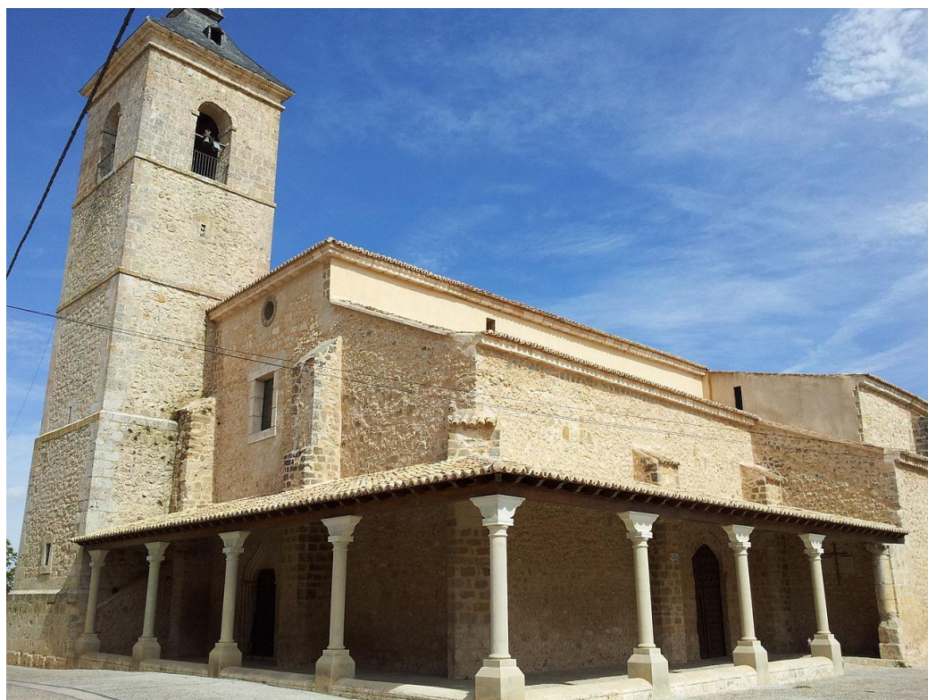
Exterior de la iglesia.

Los dos accesos se producen a través de un atrio abierto, separado de la calle por una barbacana de piedra mampuesta, que ocupa el ángulo suroeste del templo. Las fachadas son de mampostería concertada de piedra caliza, con algunos paños de sillería del mismo material. También de sillería están construidas las esquinas, los contrafuertes, las cornisas, los dinteles, las jambas y los alféizares.