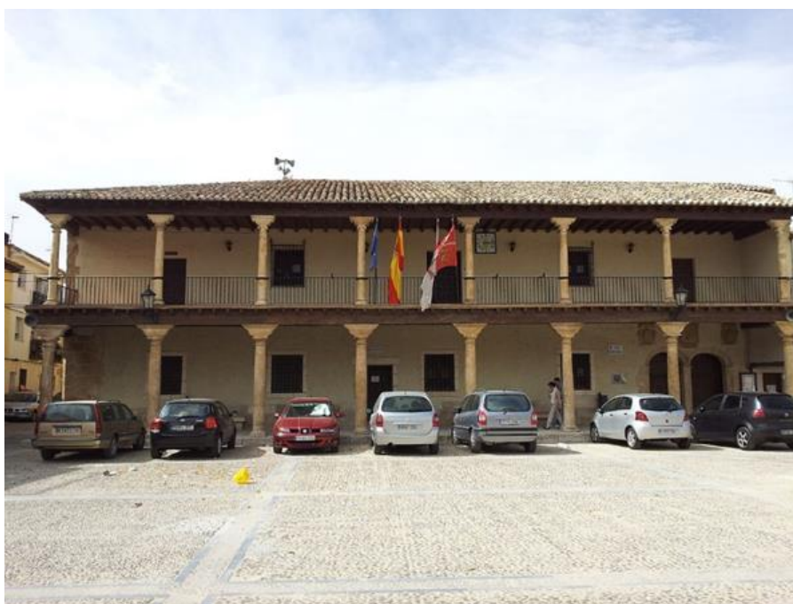
Fachada principal del ayuntamiento.

La galería superior es adintelada con cubierta de madera soportada por columnas de capitel jónico. La galería baja está soportada por columnas de orden toscano, de mayor diámetro que las anteriores, que soportan una cubierta adintelada de madera. En el extremo derecho de la galería baja se encuentra la portada principal de doble arco rebajado sustentado en el centro por un pilar renacentista labrado. Sobre la portada lucen los escudos de Carlos V de Alemania, de la Orden de Calatrava y de Fuentelencina.