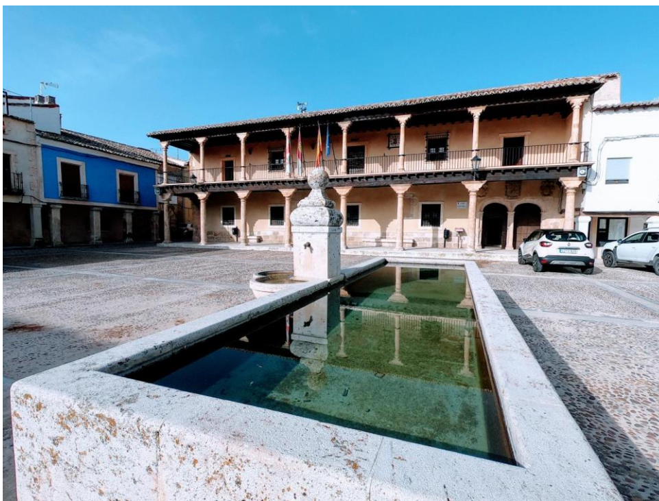
Plaza con el ayuntamiento al fondo.

Desde allí se ejercía la autoridad, se administraba justicia, se disponían precios, salarios, etc. Resumiendo, allí se organizaba la vida local en todos los órdenes. Tiene en su centro una fuente de amplio pilón, hoy totalmente renovada, y una enorme olma comunal, de cuatro siglos de existencia. Se rodea de edificaciones típicamente alcarreñas, y en su costado norte surge llenándole por completo el edificio del Ayuntamiento.