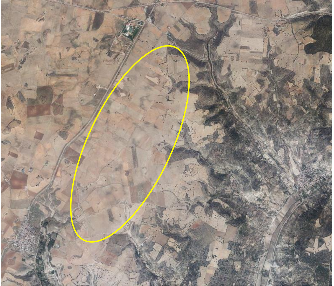
Orofoto con la zona de la ubicación del proyecto de la Planta Solar Fotovoltaica.