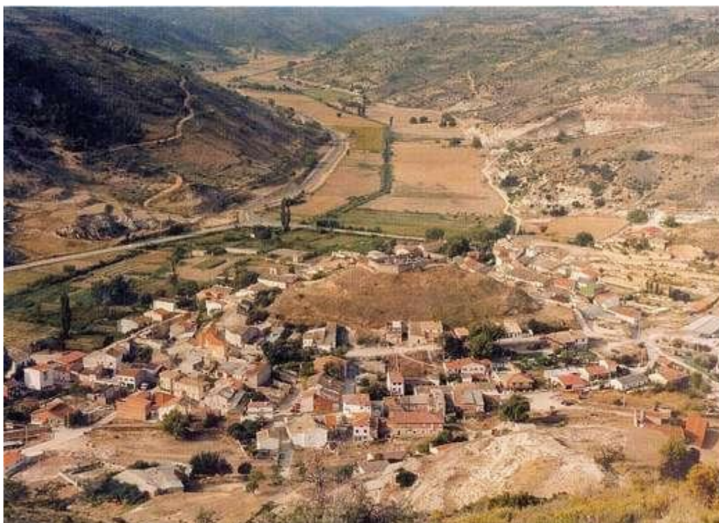
Vista panorámica del pueblo.

Alhóndiga es un municipio español de la provincia de Guadalajara, en la comunidad autónoma de Castilla-La Mancha. Tiene un área de 19,20 km 2 con una población de 172 habitantes (INE 2016) y una densidad de 10,21 hab./km 2 .