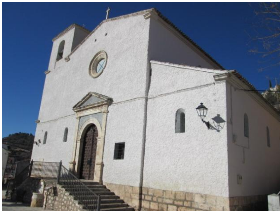
Iglesia Parroquial de Alhóndiga.