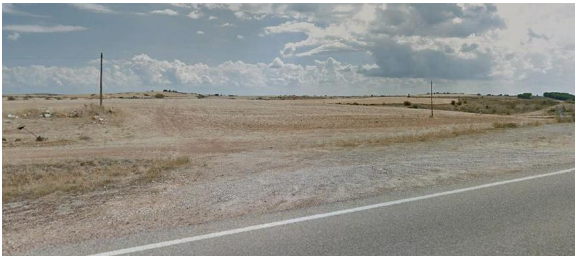
Vistas de los parajes afectados por el proyecto desde la ctra. CM-200